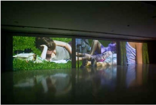
De nos jours, 2003, © Marie-Jose Burki

Marie José Burki maakt een nieuw werk voor Into the Light, de neon sculptuur 'How is it when I'm not here', die in de bomen wordt gehangen op het plein voor het KMSKA. De neon bestaat uit zinnen en uitroeptekens. De zinnen zijn triviale vragen die we allen altijd stellen. De woorden, geschreven in neon, worden in de bomen gehangen, zoals kerstdecoratie. Dit werk verwijst, ironisch, naar de timing van de tentoonstelling, een tijd van kerstbomen en decoratieve lichtslingers. Het verwijst ook naar de neons die gebruikt worden voor reclame in de openbare ruimte. Er is ook de ironische verwijzing naar de private en de publieke ruimte, en de idee van tijd en ruimte. Dit kan tegelijk simpel en pretentius lijken. Het alledaagse, het banale dat door een simpele ingreep een quasi mysterieuze dimensie krijgt is een constante in het werk van Marie José Burki.