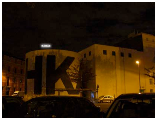
Stefano Cagol, " W ", 2009, neon installation, simulation, M HKA, Antwerp