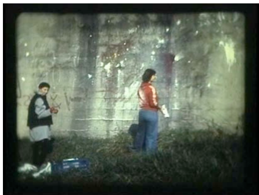
Collectie M HKA, Antwerpen

De schilderijen en de films van Wilhelm Sasnal getuigen van een intense gevoeligheid voor de ons omringende wereld en tegelijkertijd van een kritische blik. Sasnals kunst bevindt zich aan de kant van de zwakke, hij herkent het creatieve potentieel van stoornis en vaagheid en ziet de uit de hand gefilmde amateurfilms als kritische tegenhanger van de onophoudelijk en gevaarlijk evoluerende wereld.